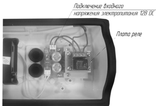
Схема подключения дополнительного обогрева в автоматическом режиме, используя плату реле и встроенный обогрев кожуха: