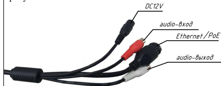
Рисунок 1 – Подключение IP-видеокамеры

9.6. Подключение IP-видеокамеры приведено на рисунке 1.