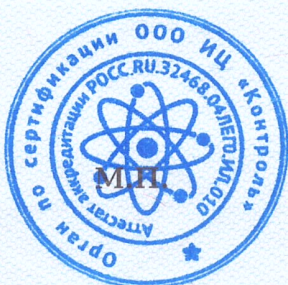
СХЕМА СЕРТИФИКАЦИИ 1с (ГОСТ Р 53603-2020. Оценка соответствия. Схемы сертификации продукции в Российской Федерации).